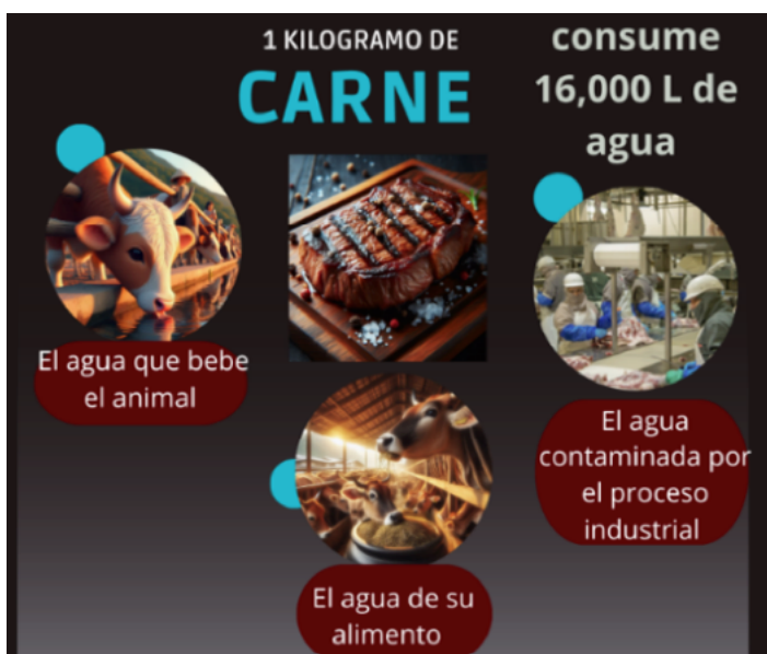
Figura 2. El consumo de agua virtual para la carne de res (Rodríguez y Montalvo, 2024).

Un ejemplo sería la cantidad de agua involucrada en la producción de un kilogramo de carne de res (figura 2). No solo se considera el agua que contiene la propia carne para hamburguesa sino también la que bebe el animal durante su vida, la empleada en el mantenimiento para la producción de su alimentación y la contaminada durante todos los procesos industriales y de transporte. Por lo tanto, para generar 1 kilogramo de carne de res se necesita consumir 16,000 litros de agua (En estado Crudo, 2020)