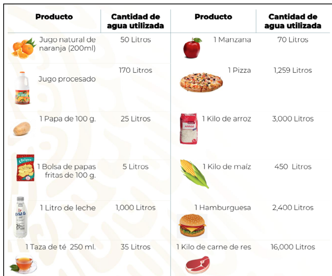
Figura 6. Agua virtual empleada en diversos productos (CONANP, S/F)

Algunos ejemplos de agua virtual empleada en la producción de diversos productos, para producir un kilogramo de café tostado, se requieren 21000 litros, para una taza de café 7 gramos, resultado de un requerimiento de 140 litros por taza ahora que, si en su lugar preparamos una taza de té, este requiere de 30 litros para 250 mililitros para una taza, cien litros menos que la taza de café. Otros ejemplos se muestran en la figura 6.