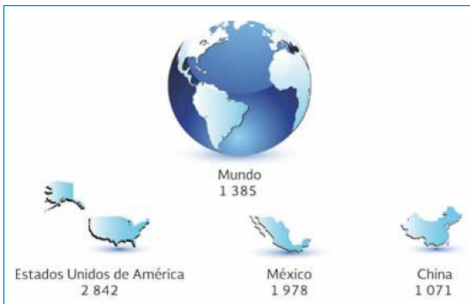
Figura 3. Huella hídrica en México, EUA y China (CONAGUA 2015)