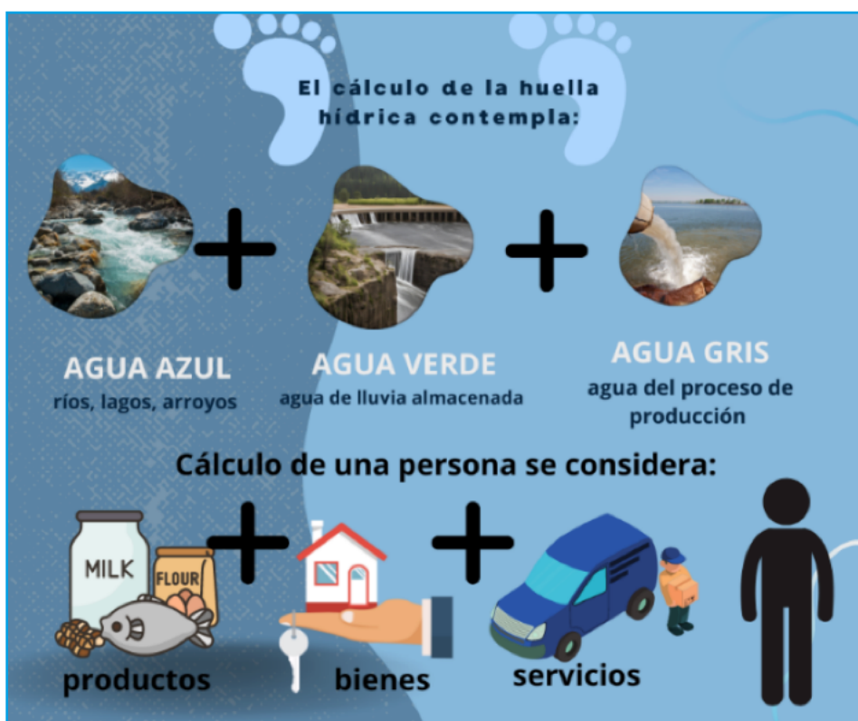
Figura 4. Cálculo de la huella hídrica (Rodríguez y Montalvo, 2024)

El análisis de la huella hídrica nos permite visualizar el uso oculto del agua y señala la ruta que sigue a través de un producto, proceso, industria, consumidor, cuenca, estado o país. Esto nos brinda la oportunidad de evaluar su sostenibilidad y determinar cómo y dónde el consumo en un lugar afecta los recursos hídricos en otro sitio. Por lo tanto, es crucial reconocer que los problemas relacionados con el agua